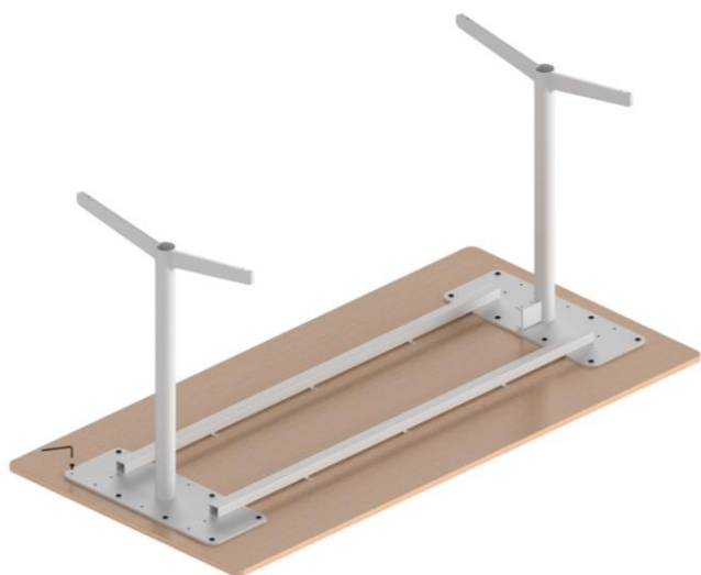
Figur 1/ Figure 1

Placera stativet på bordsskivan. Använd skruv (B) för att fästa skivfästen. Se figur 1. Avsluta med att skruva fast sargerna i bordsskivan med skruv (C). Se figur 2. Place the stand on the table top. Use screw (B) to mount the table brackets. See figure 1. Finish by mount the rails to the table top with screw (C). See figure 2.